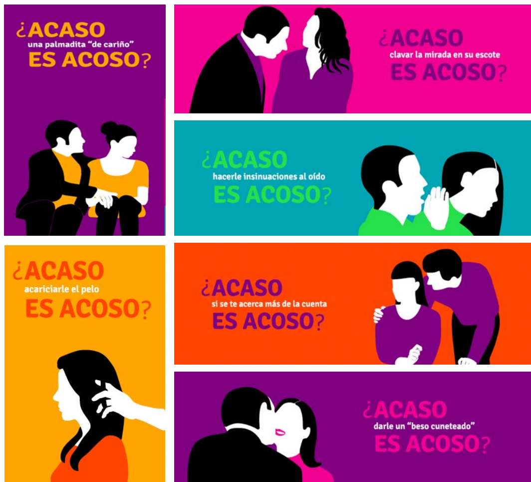
Figura 2. Imágenes que circularon en formato de afiches en los distintos tribunales de justicia del país.

formar a las personas sobre el rechazo de la institución a las conductas de acoso sexual.